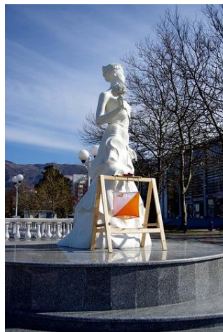
Кубок России, г-к Геленджик, март 2012г.