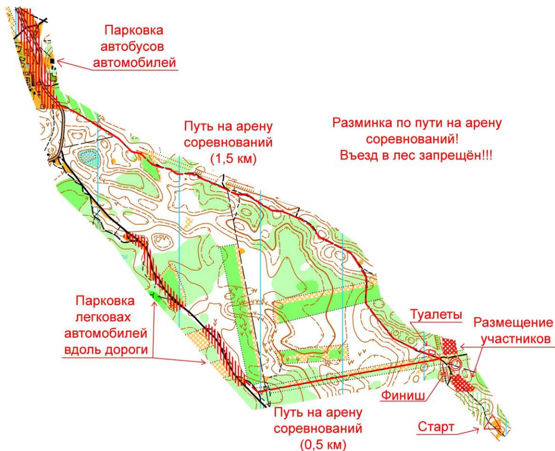
Схема 3 дня соревнований