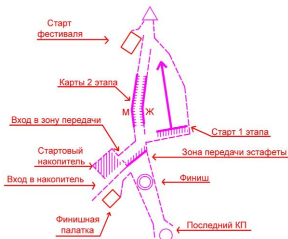
Схема передачи эстафеты

Организация старта – финиша: От старта до пункта «К» 120 м., от последнего КП до финиша 40 м. После прохождения дистанции участник 1 этапа сначала отмечает в станции финиша, потом передает эстафету 2 этапу, далее движется на считывание. Участник на втором этапе движется вдоль маркировки к картам, самостоятельно берет карту со своим номером. Карты располагаются на сетке, на карте и над картой есть номер, соответствующий номеру участника. С лева, по ходу движения располагаются мужские карты, а с право – женские. Нумерация карт по возрастанию.